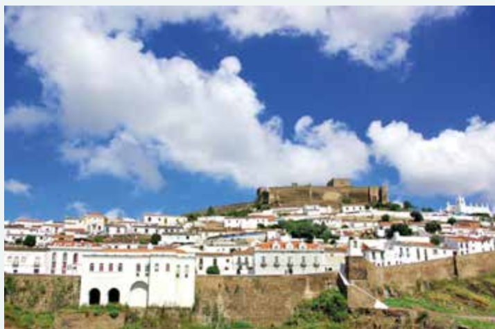
Mertola Blick auf die Burg