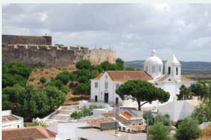
Castro Marim Blick auf die Kirche Igreja de Nossa Senhora dos Mártires