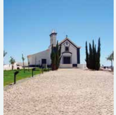
Castro Marim Stadtansicht

Die Magie des Südens von Portugal. Ein ganz besonderes Naturschauspiel erleben Sie an der Algarve an diesen Tagen: die Mandelblüte. Wie von Zauberhand verändert, erscheint die Algarve plötzlich ganz in Weiß und Rosa gehüllt. Ein zarter Duft von Mandelaromen liegt in der Luft. Die Portugiesen nennen diese Zeit – die Ankündigung des Frühlings. Überzeugen Sie sich selbst !!!