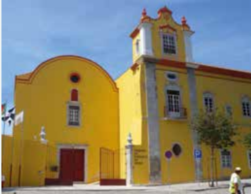
Tavira Innenstadt