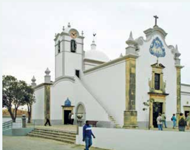
Almancil Kapelle São Lourenço dos Matos ©Marc Ryckaert CC BY 3.0 ( http://bto.de/CCBY3 )